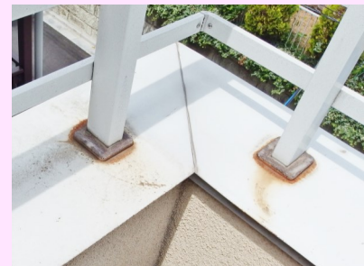
支柱の付け根から雨水が入らないかをチェックします