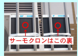
サーモクロンはこの裏