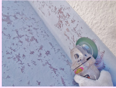
電動グラインダーで削ります