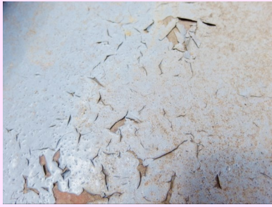
FRP床の上塗り塗装の剥がれ

FRPは浴槽やプールなどにも使われる素材で、丈夫で硬く水にも強いのですが、 基材が太陽光線に弱い ため 表面塗装が重要 になり、この床のグレー色がハガシしている不具合が多く見受けられます。