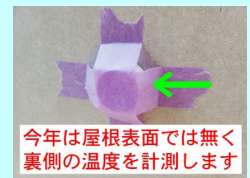
今年は屋根表面では無く裏側の温度を計測します

右下(4)のトーナメント図のように、「エスケー化研」「日本ペイント」「ミスタニ」「日本特殊塗料」の4つのメーカーごとの遮熱塗料と下地を組み合わせた塗り板を準備し、まず「各メーカーのNO. 1」を調べ、それから「遮熱塗料NO. 1」を調べます。