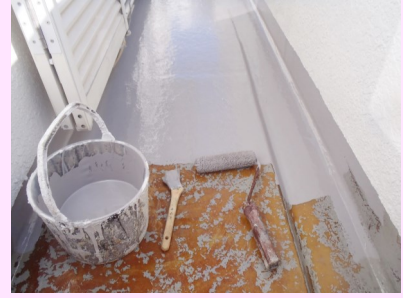
しっかり下地を作って再塗装

対策としては早めに再塗装となりますが、既に剥がれている部分があるために、 その上に塗装をしてもまだハガシの可能性が残ります 。そのまま塗るのでは無く、写真の事例のように グラインダーで剥がせる所は撤去の必要 があります。